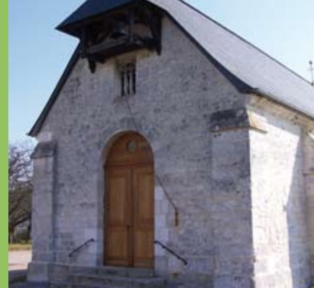
◀ La chapelle du bout du vent

Un aller retour par le bac et Hélène vous emmènera à la chapelle du Bout du vent achevée en 1730, marquant la limite des vents porteurs, d'où la provenance de son nom.