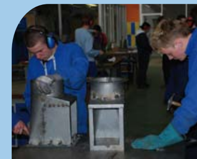
CENTRE DE FORMATION Les futurs chaudronniers

Pour son avenir, il a l'intention de se spécialiser soit tuyauteur soit soudeur, toujours en alternance.