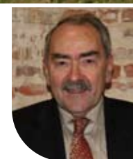
JEAN-CLAUDE WEISS Président de la Communauté de communes Caux vallée de Seine