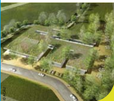
La future Maison des compétences à Lillebonne

Le Conservatoire Caux vallée de Seine accueille près de 1 000 élèves et propose plus de 50 disciplines en passant par les instruments à vent, à cordes, la danse, le chant, les ensembles instrumentaux... Le Conservatoire est classé nationalement Conservatoire à rayonnement départemental. ■