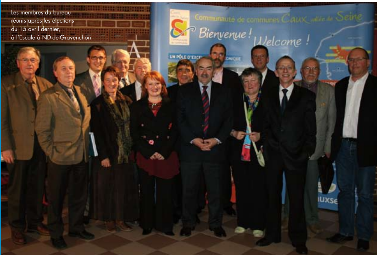
Les membres du bureau réunis après les élections du 15 avril dernier, à l'Escale à ND-de-Gravenchon

Plusieurs commissions thématiques sont mises en place pour traiter des différents domaines d'intervention de la Communauté de communes. Elles sont composées de conseillers communautaires et de techniciens et sont le lieu de débats où sont proposés et discutés les projets élaborés par les élus et les services intercommunaux. Ces commissions, après étude des dossiers, font des propositions au Président et au Conseil communautaire mais elles n'ont pas de pouvoir de décision propre. Les services intercommunaux composés de techniciens et professionnels de chaque secteur d'intervention mettent en œuvre la stratégie et l'ensemble des décisions prises par les élus.