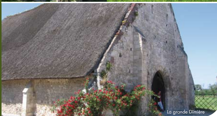
La grande Dîmière