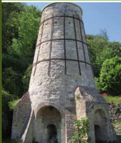
À la découverte du patrimoine en randonnée

▼ La grange Dîmière du XIII e siècle sera ouverte exceptionnellement par ses propriétaires et vous dévoilera son architecture et ses secrets lors de la randonnée du 13 août.