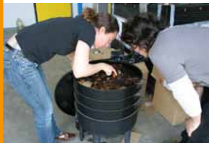
Expérimentation du lombricompostage aux services techniques

ZONE INDUSTRIELLE des Compas 76170 Lillebonne Tél. : 02 32 84 00 35