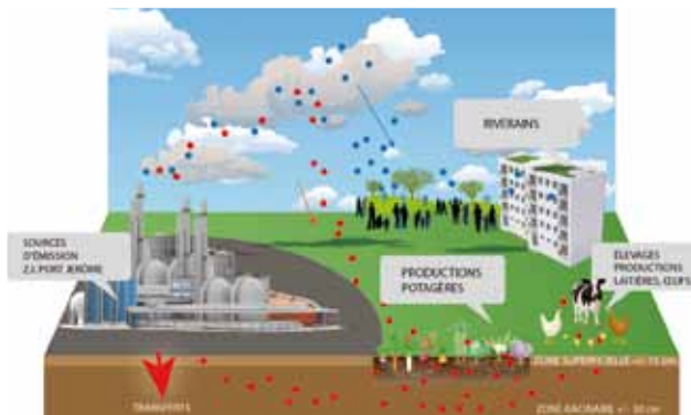
Schéma de l'exposition aux rejets atmosphériques sur le site de Port-Jérôme

Infos : www.cauxseine.fr ou www.ars.haute-normandie.sante.fr (Rubrique « votre santé »).