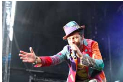
Le concert de Christophe Maé en juillet 2011 a accueilli 11000 fans.

Les animations et grands spectacles se sont développés sur le parc EANA depuis 2008.