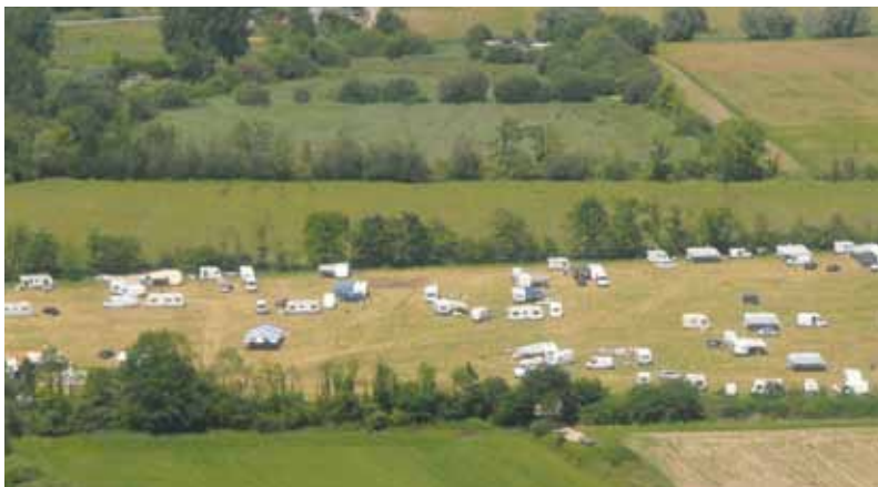
Conformément aux statuts, la CVS assure la gestion et l'aménagement des aires d'accueil.