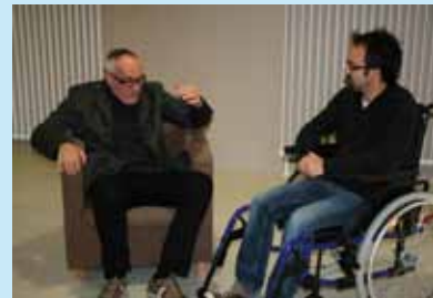
La compagnie Dram Bakus le 17 novembre dernier

Dans le cadre de la semaine du handicap qui a eu lieu du 15 au 18 novembre, la Maison des compétences a proposé une journée « coaching et image de soi », en partenariat avec l'association « Handiciper ». Cet atelier avait pour objectif d'aider les handicapés à s'insérer dans le monde l'entreprise. Un nouveau rendez-vous sera programmé courant 2012.