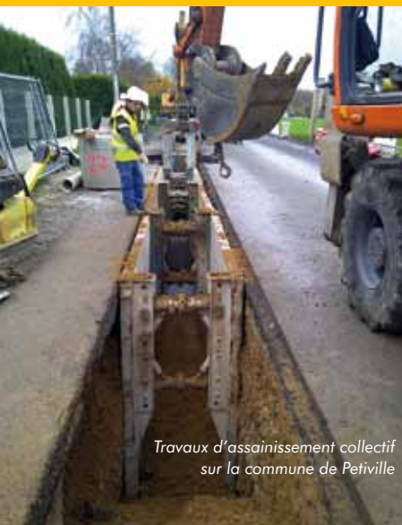
Travaux d'assainissement collectif sur la commune de Petiville