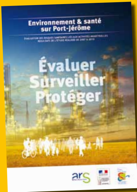
Une plaquette présentant les résultats de cette étude est disponible